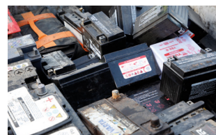
Piles et accumulateurs au plombs