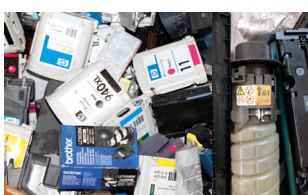
Déchets de toner d'impression