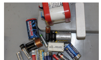
Piles et accumulateurs mélangés