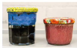
Déchets solides non identifiables