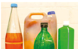
Déchets liquides non identifiables