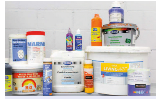
Peintures sans solvant