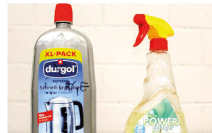
Produits chimiques liquides