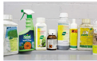
Phytosanitaires (pesticides) liquides